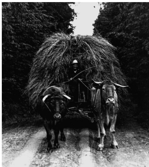
De Hööware mem Bapp